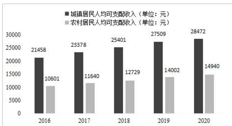
图 1-3 “十三五”期间两个收入的变动情况（单位：元）