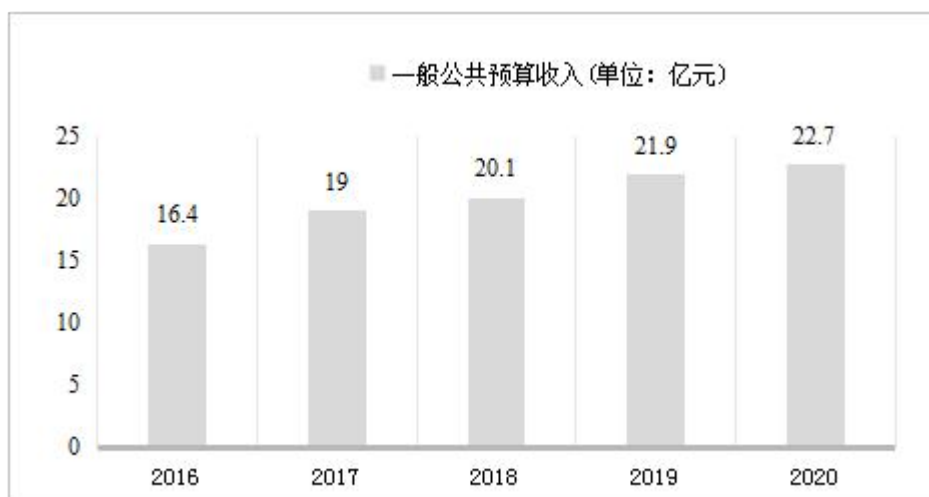
图 1-2 “十三五”期间一般公共预算变动情况（单位：亿元）